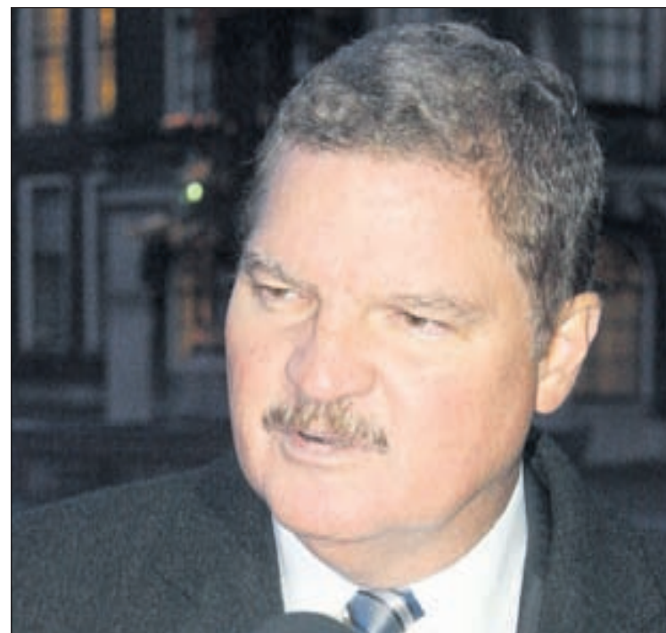
Minister Mike Eman

encia lo sigura Hulanda cu e deseo pa funciona den un forma constructivo ta mas amplio cu unicamente e Gobierno di asignatura berde; e tin un base grandi den e pais y esnan cu ta bisa algo diferente, ta papiando den forma extremo y no ta carga aprobacion ni di un parti grandi di nan partido. Lo muestra riba e Nota cu Aruba a entrega cu ta duna indicacion cla riba tur e areanan cu por coopera hunto den Reino. Esey ta solamente e inicio di e oportunidadnan di apertura entre Europa y Sur America. Esey ta e punto di salida di Aruba y lo trece esaki dilanti cu tur e documentonan cu tin. Pa Corsou e reto lo ta e posicion cu